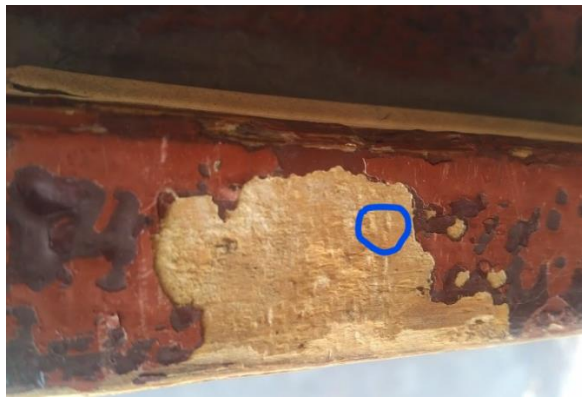
Fotografia nr 4: kolor malowania drzwi wejściowych do budynku przy ul. Chałubińskiego 5;

Szklenie szkłem bezpiecznym, laminowanym, przezroczystym, w klasie antywłamaniowej RC4.