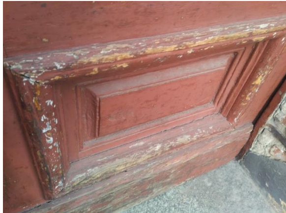
Fotografia nr 3: Zdjęcie płyciny drzwi wejściowych do budynku przy ul. Chałubińskiego 5;